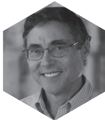
Carl E. Wieman Premio Nobel de Física e Investigador en la Transformación de la Enseñanza de la Ciencia